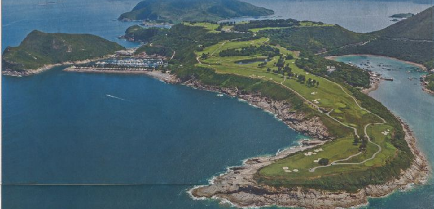
圖:清水灣鄉村俱樂部

清水灣鄉村俱樂部(下稱:「清水灣」)自二〇〇三年起已開展「清水灣·走入社群」計劃,以「家庭、鄰舍、環境保育」(Family Care, Neighbourhood Harmony, Environmental Conservation)為服務重點,帶動會員多方面回饋社會,幫助社會不同年齡、不同階層的有需要人士,為社會出一分力。「清水灣」不時與各慈善組織如安徒生會、基督教勸行會、突破機構等舉行多元化活動,如安排暑期活動、舉辦長跑賽及探訪「老友記」等,另外亦會與母親的抉擇、基督教靈實協會、香港保護兒童會、地中海貧血兒童基金會舉辦慈善高爾夫球賽,藉以傳揚愛與溫暖,多年來合共籌得逾七千萬元善款,未來將會進一步將計劃推廣開去,讓更多有需要人士受惠。