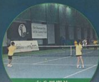
向公眾開放 會所設施

「清水灣」一直有開放設施供民眾免費使用(HAB)認可的各類型團體使用,讓公眾人士享受有益身心的康體活動,加深認識高爾夫球運動。除此之外,「清水灣」亦提供其他運動設施,如網球場、壁球場等,平日或假日均向外開放,讓「清水灣」真正「走入社群」。