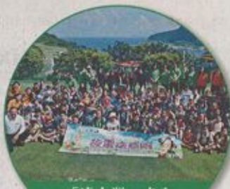
「清水灣·走入 社群」計劃

「清水灣」致力提供優質的高爾夫球場其他娛樂休閒設施,多年來曾與不少慈善團體合辦多項慈善高爾夫球賽,當中「基督教靈實協會」慈善高爾夫球賽更是每年的亮點,善款全數撥捐基督教靈實協會,用作添置慈善床位,讓更多院友能夠安度晚年。