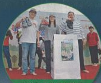
協辦各慈善步行籌款

「清水灣」一直有開放設施供民眾免費使用(HAB)認可的各類型團體使用,讓公眾人士享受有益身心的康體活動,加深認識高爾夫球運動。除此之外,「清水灣」亦提供其他運動設施,如網球場、壁球場等,平日或假日均向外開放,讓「清水灣」真正「走入社群」。