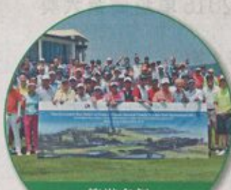
籌辦多個 慈善高球賽

「清水灣」每年接待不同機構的兒童來到「清水灣」舉辦活動,包括安徒生會、香港障障高爾夫球協會、蘋果慈善基金及扶康會等。他們來到「清水灣」游泳、打網球、看書及玩遊戲等,有益身心發展,在「清水灣」度過充實的一天。