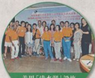
善用「清水灣」設施 支持社區活動

去年10月1日至4日「清水灣」聯辦舉行「亞太業餘高爾夫錦標賽2015」,賽事為高爾夫球界的盛事之一,更是首度在香港場地舉辦,齊集來自亞太區共120位選手參與,為全港觀眾呈現一場世界級高爾夫球賽事。「清水灣」希望可以透過這次機會展示香港在高爾夫球界的優勢,不但擁有國際級的高爾夫球場,更能舉辦頂尖高球賽事,令世界各地的高爾夫球迷對香港留下深刻印象。