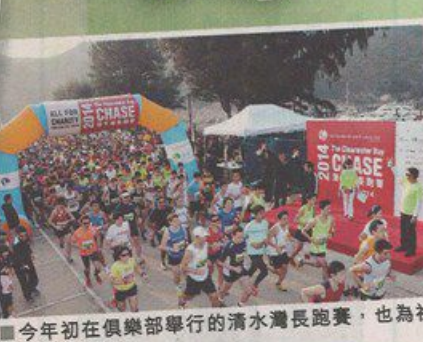
今年初在俱樂部舉行的清水灣長跑賽，也為社福界籌得善款。