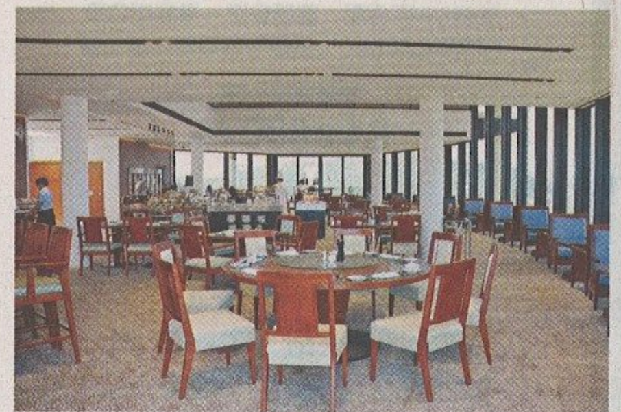
■「清水灣」高爾夫球會所內的Horizons餐廳的擴建工作已經完成，為會員提供更優質的用餐場地。