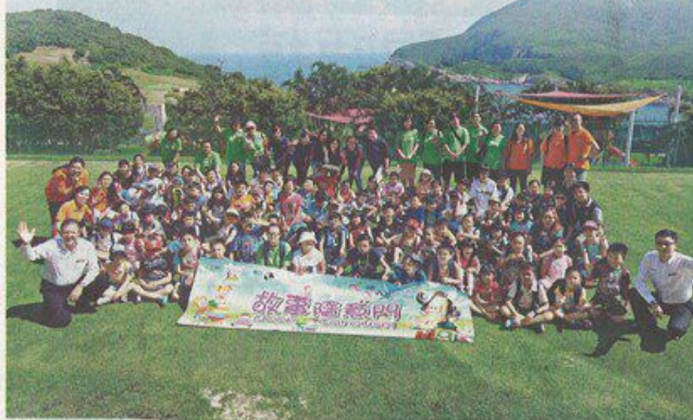
■100名基層兒童在清水灣鄉村俱樂部的草地上，和義工進行閱讀遊戲。

清水灣鄉村俱樂部擁有海天一色的優美景致及優良的體育設施，更一直堅守「取諸社會、用之社會」的信念。自2003年起已開展「清水灣·走入社群」計劃，帶動會員從多方面回饋社會。多年來，清水灣鄉村俱樂部一直與安徒生會緊密合作，今年則首次贊助「故事隨意門」計劃，期望拉闊小朋友的閱讀空間之餘，也令基層父母更明白閱讀對小朋友成長的重要性。